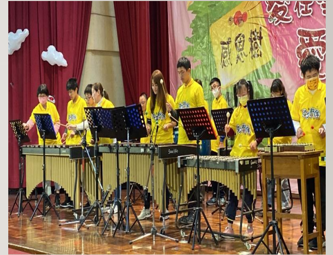
北投扶輪社感恩餐會 打擊樂學生表演