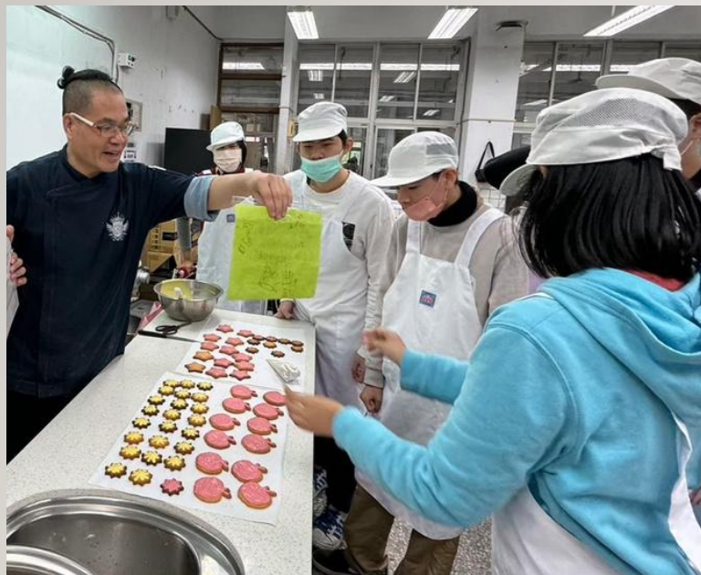
西式點心餅乾烘焙