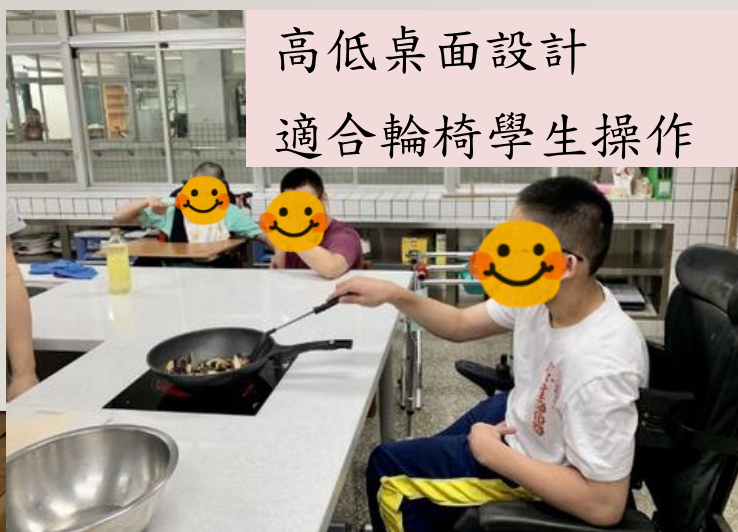
高低桌面設計 適合輪椅學生操作