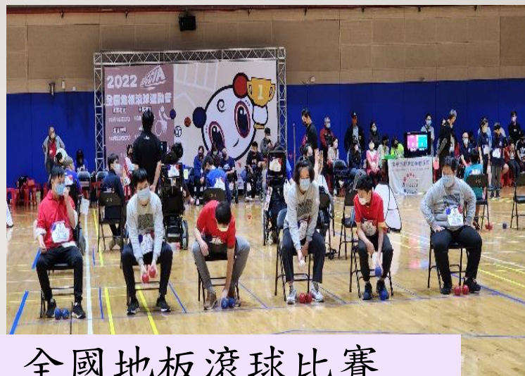
全國地板滾球比賽